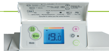
Boîtier de commande digital

permet de bloquer l'accès aux réglages de l'appareil afin d'empêcher toute modification intempestive.