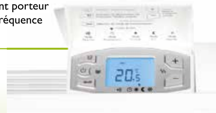
Boîtier de commande digital