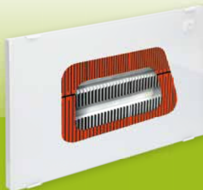
1 modèle 3 puissances Coloris Blanc