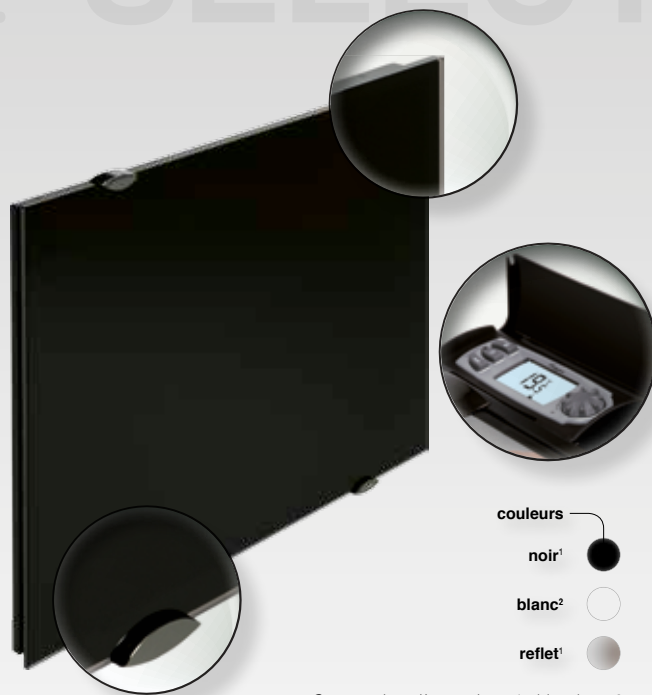
Carrosserie arrière : noire = 1 - blanche = 2

Pour optimiser les économies d'énergie, Campaver SELECT peut faire l'objet d'une programmation centralisée par fil pilote et radiofréquence ou par cassette individuelle fil pilote ou courant porteur.