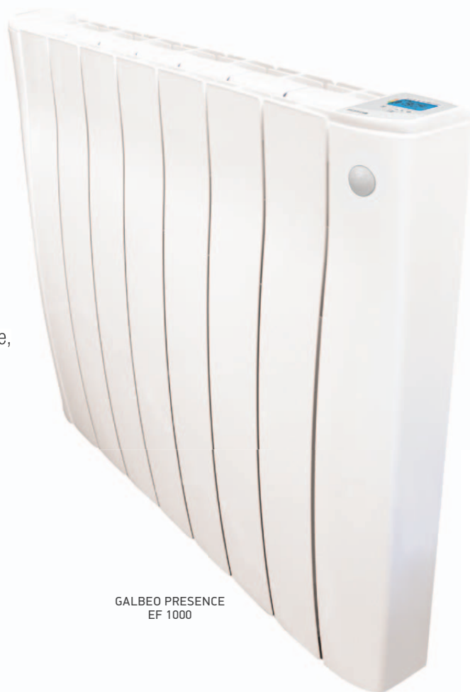
GALBEO PRESENCE EF 1000