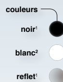
Carrosserie arrière : noire = 1 - blanche = 2

Campaver Bains, c'est l'élégance technologique, l'intelligence du choix des matériaux et des solutions mises en œuvre pour tendre vers un but unique : se sentir bien chez soi et ne jamais consommer plus que nécessaire.