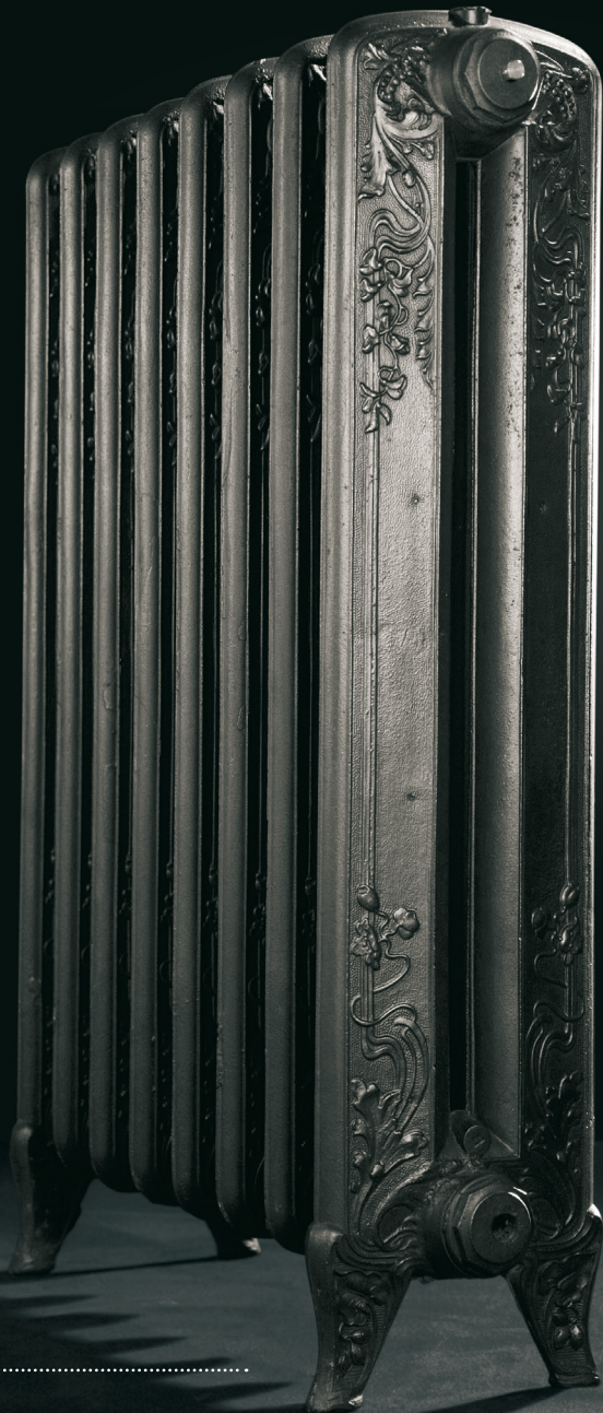
MANDIR Réf. 0000