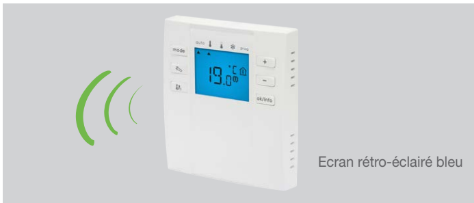
Ecran rétro-éclairé bleu