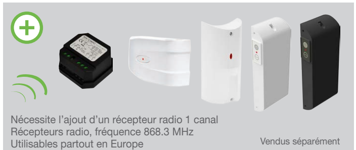
Nécessite l'ajout d'un récepteur radio 1 canal Récepteurs radio, fréquence 868.3 MHz Utilisables partout en Europe